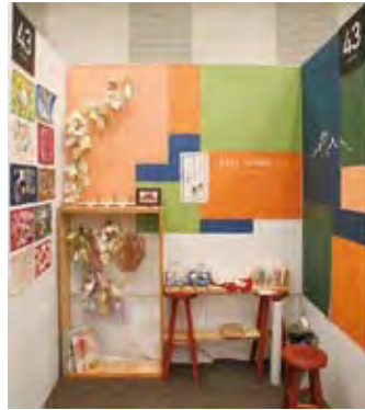
043 KIRI WORK