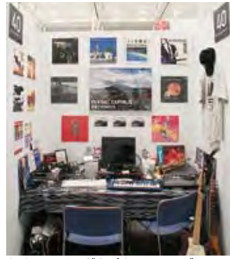
040 フライングタビルスレコース