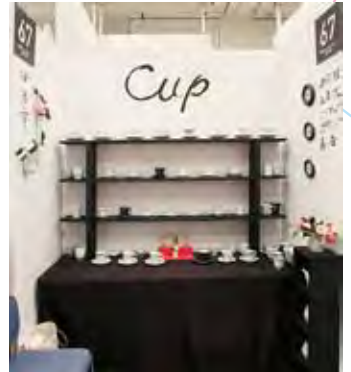
067 艸茅窯 [ソウボウガマ] 川野 恭和