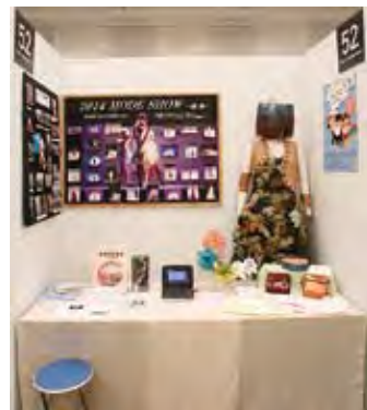
052 学校法人 野村服飾専門学校