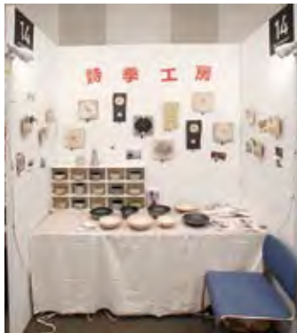
014 詩季工房 [細山田敬子]