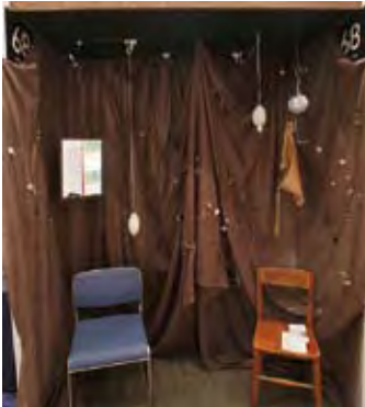
068 dolce vita