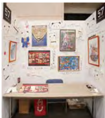
057 パンダ絵師 あごばん