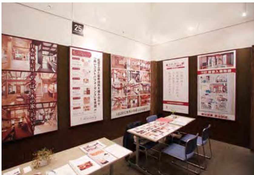
025 小山工建(株) サイエンスホーム