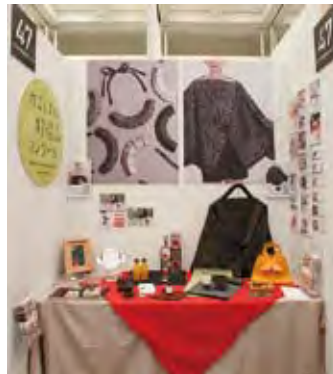
047 かごしまの新特産品コンクール