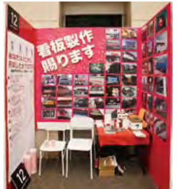
012 THUNDER WORKS