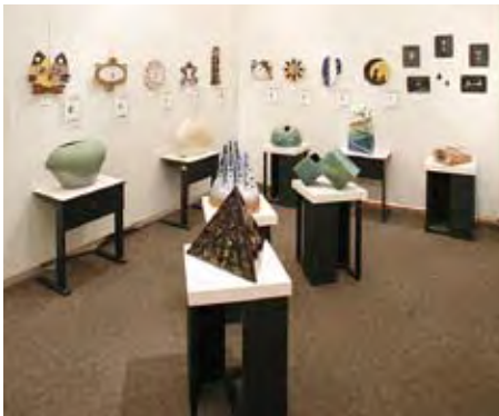
003 鹿児島純心女子短期大学 生活クリエイトコース