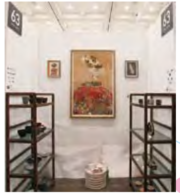
063 White Gallery