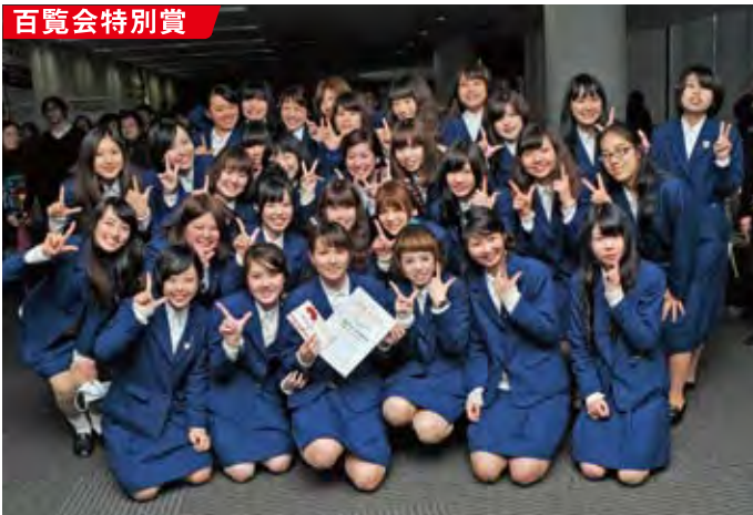
●鹿児島純心女子短期大学 生活クリエイトコース