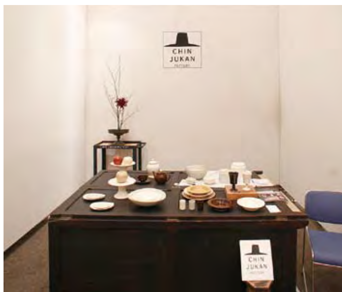
008 チンジュカンポタリーストア