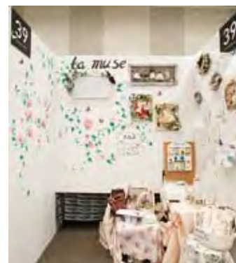
039 la muse(らもぜ)