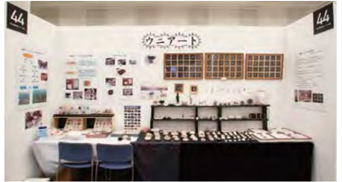
044 (有)尾塚水産・ウニ工房