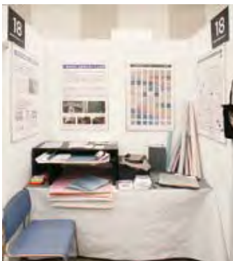
018 鹿児島県工業技術センター