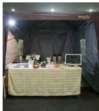
060 SANDECO COFFEE 数学カフェ / 数学塾