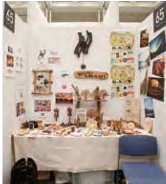
065 hardies アルディ