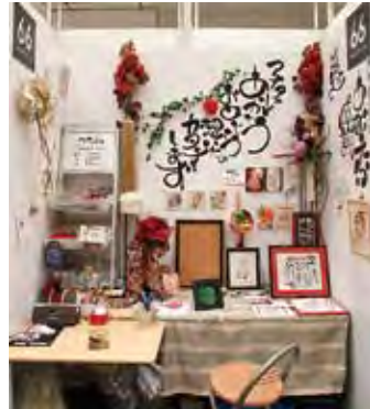
066 AminoF [アミノエフ]