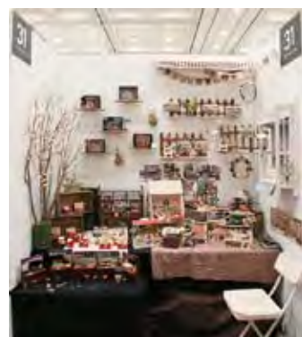
031 Artisanat Karky