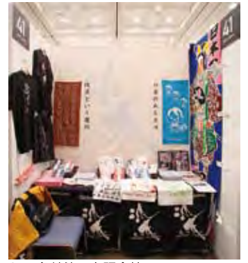
041 亀崎染工有限会社