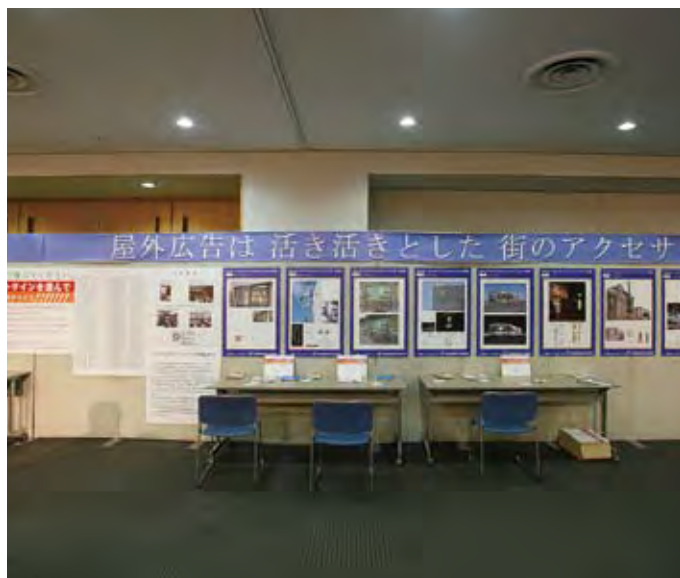
021 鹿児島県屋外広告士事務所