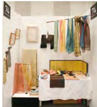
074 工藝染織 越間巽大島紬工房