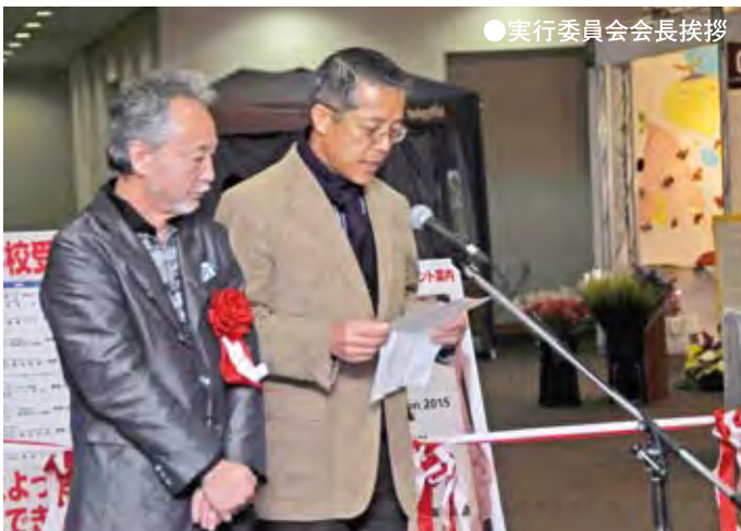
●実行委員会会長挨拶

第24回かごしまデザインフェア2015「デザイン百覧会」が成功裡に終えることができました。心から厚くお礼申し上げます。