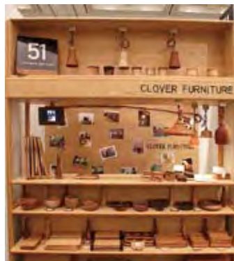
051 CLOVER FURNITURE