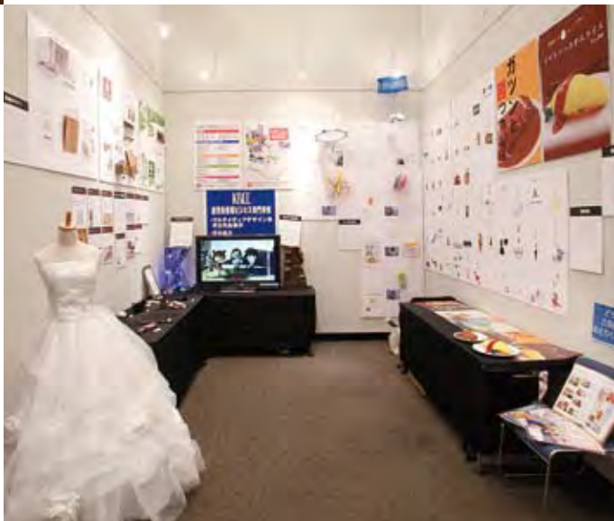
022 鹿児島情報ビジネス専門学校