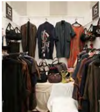
015 着物のリフォームとバッグ AOI