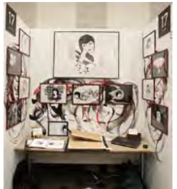
017 脇 宣恵