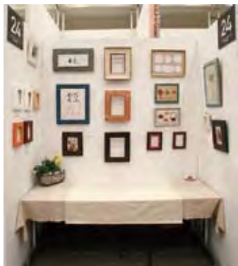
024 アトリエ イルドパニエ 穎川恭子