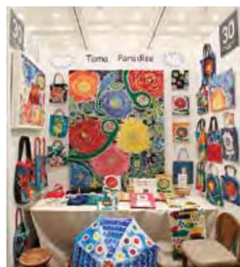
030 Tama Paradise.(田尻 環)