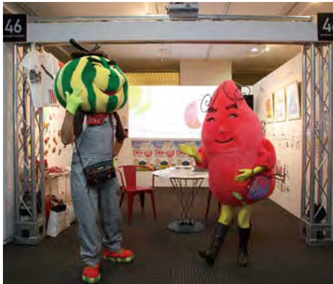
046 (医)橋口医院・(社福)徳光苑