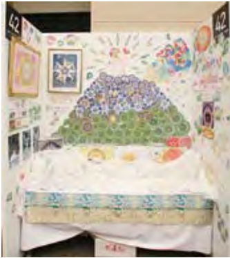
042 文字アートギャラリー 安徳庵