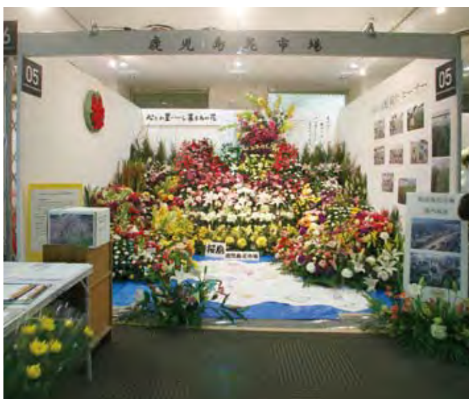
005 鹿児島県花弁園芸農業協同組合