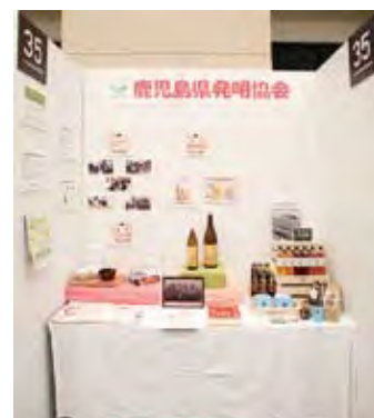
035 (一社)鹿児島県発明協会