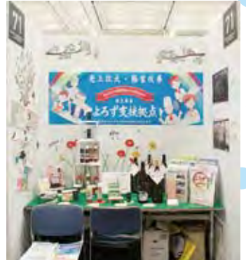
071 (公財) かがしま産業支援センター