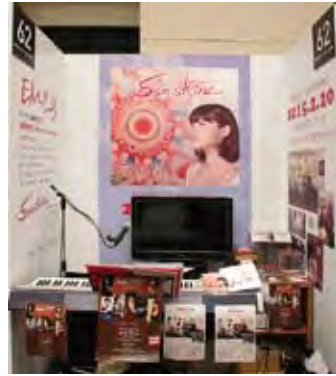
062 柳田博文+Sun Shine+EMILY