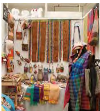
029 NPO法人 さをり工房うえーぶ