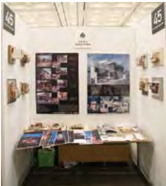
045 (株)小森昌章建築設計事務所