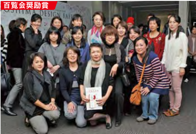
●フラワースペースM-24