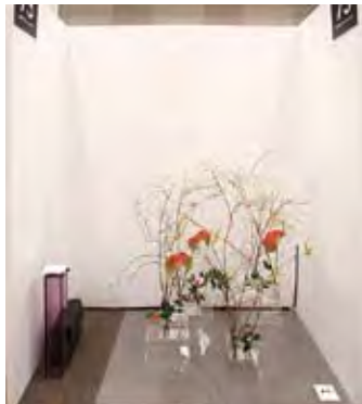
073 川邊佳乃 [tau works]