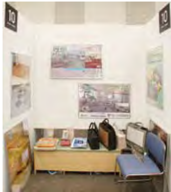
010 (株)仙夢・小田量商会