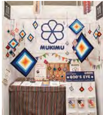
011 MUKIMU Workshop