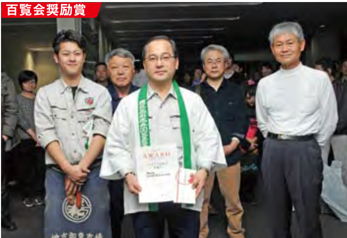
●鹿児島県花卉園芸農業協同組合