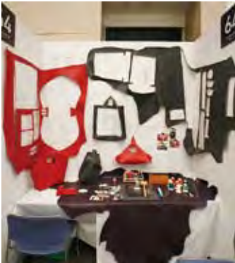
064 SNOW &amp; 革工房 エルノワ