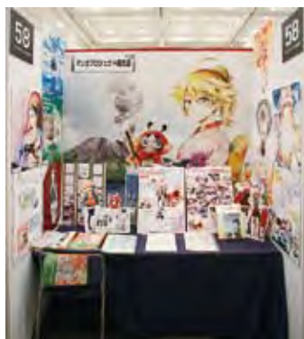
058 マンガプロジェクト鹿児島