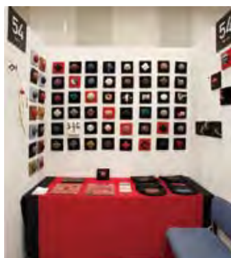
054 野田 水木