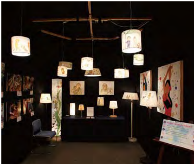
034 デザイン Iyori &amp; 和紙 Taneda