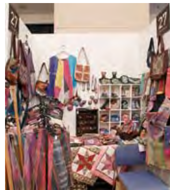
027 アトリエ ちゅうりっぷ