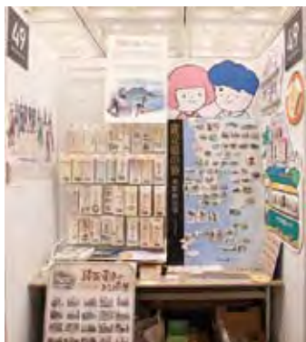
049 愛かごしまプロジェクト