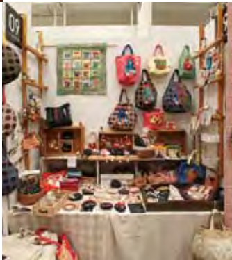
009 こっとなはうす 針仕事