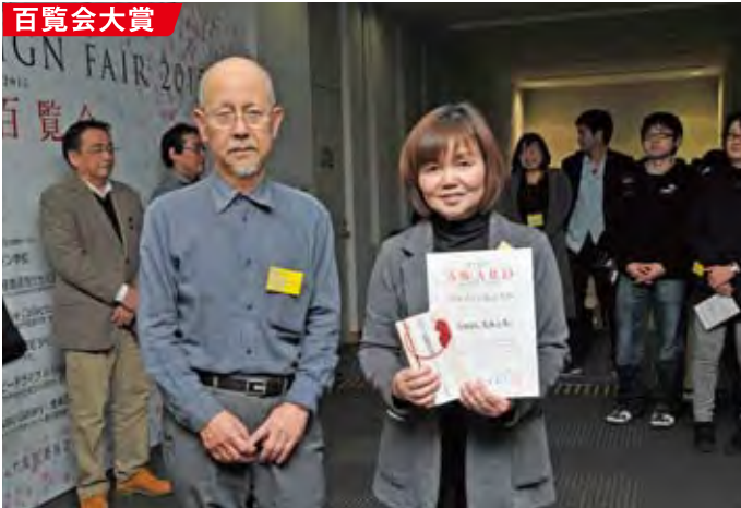
●(有)尾塚水産・ウニ工房