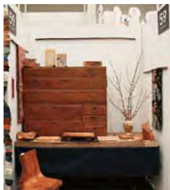
059 MOTTIN [モッチン]