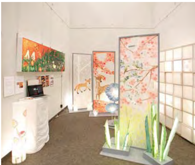
032 Kashi design lab.