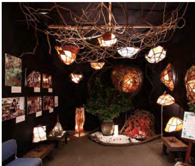
033 伊作和紙を復興する会