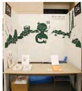
004 イラストレーター 竹添星児