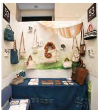
053 和紙ギャラリー 野田寿子