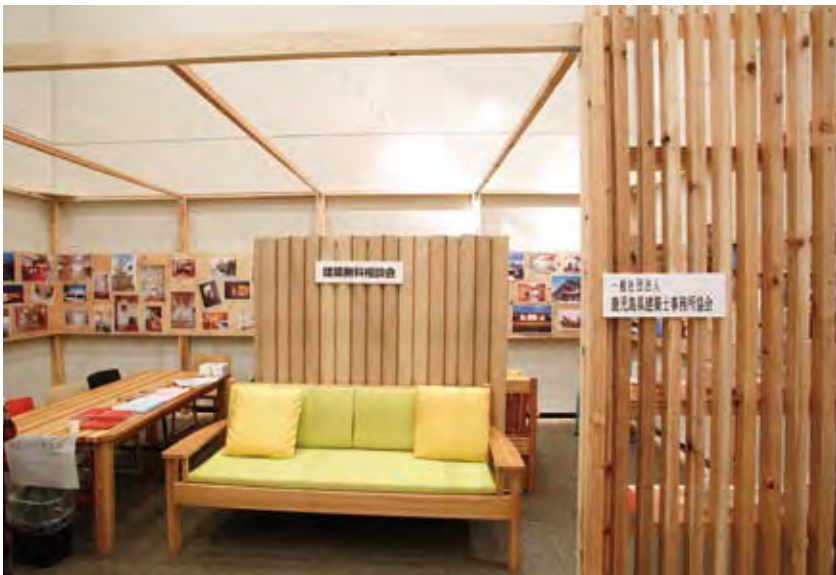
007 (一社)鹿児島県建築士事務所協会