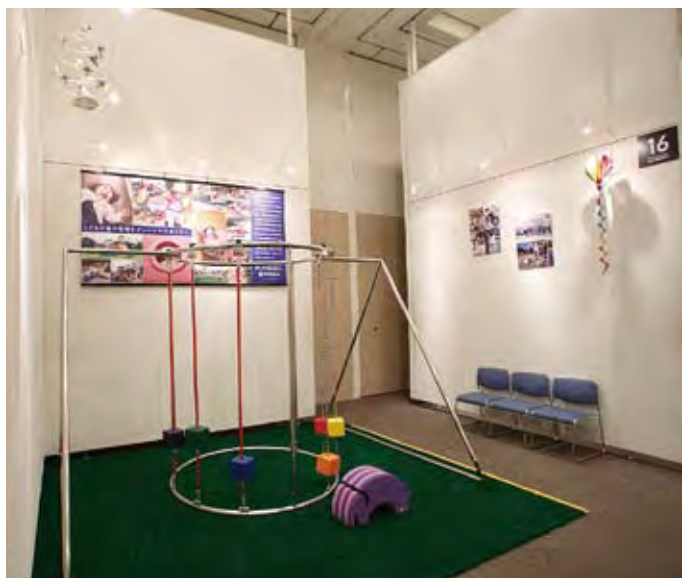
016 PLAYGLOBAL 丸竹工業有限会社