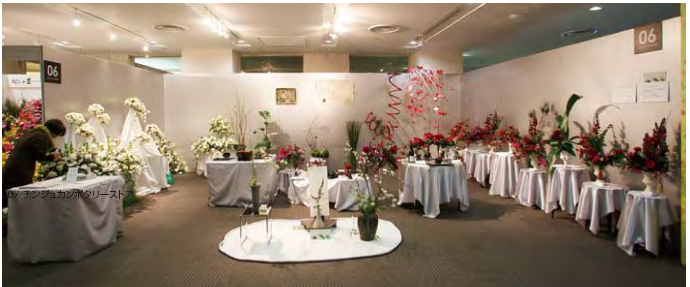
007 チンジュカンポタリーストア