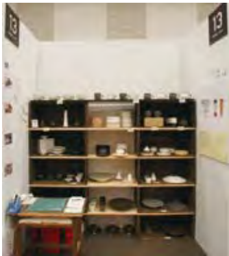
013 御茶碗屋 つきの虫