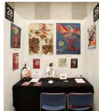
028 鳳宮堂[ほうきゅうどう] 鳳 富子