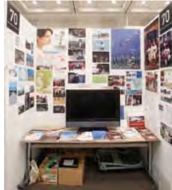
070 NPO かがしまフィルムオフィス